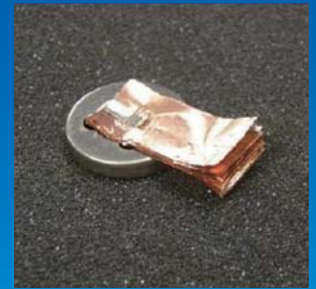
圆柱型动力电池焊接