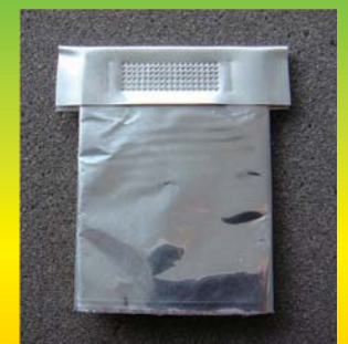
铝箔&铝TAB包焊 (8 × 25)