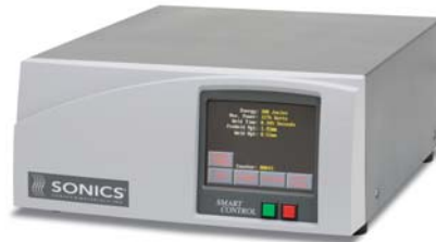
智能控制触摸屏功率箱