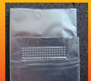
过渡片/铝箔 (25 × 8)